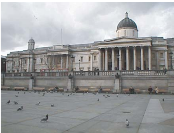
写真-1 リニューアル以前のトラファルガー広場。高い壁の後ろは車道、さらにその背後に見えるのがナショナルギャラリー。

[完成・事後評価] 2003年7月に再生オープン。市民の関心も高く、概して高い評価を得ている。また、当初の目的を実現しているかどうかを検証するため、従後の歩行者の行動調査が行われ、良好な結果を得た。