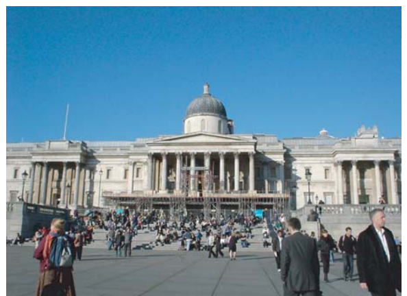
写真-2 現在のトラファルガー広場(2004年11月)。新たに設置された大階段の先に、改装中のナショナルギャラリー正面玄関が見える。